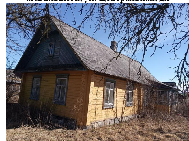
аг.Бильдюги, ул. Центральная, д.3