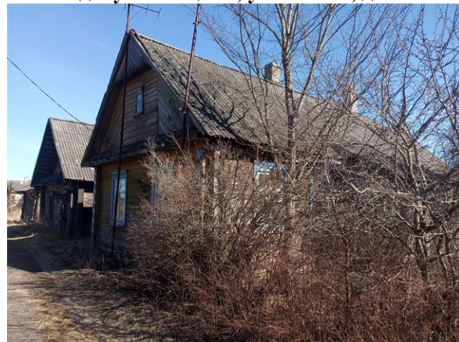
д.Вишневец, ул.Вишнёвая, д.4А