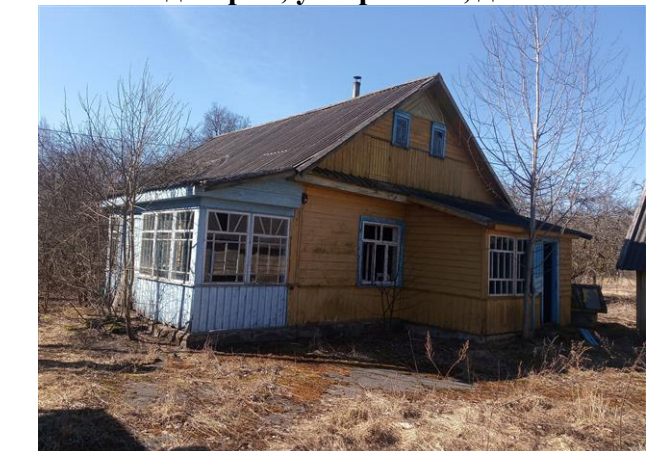
д.Борок, ул.Грибная, д.6