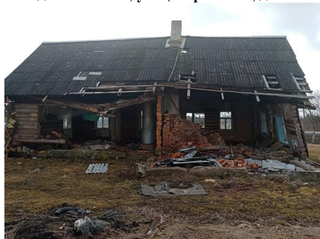
д.Коты, ул.Ковшелевская, д.7