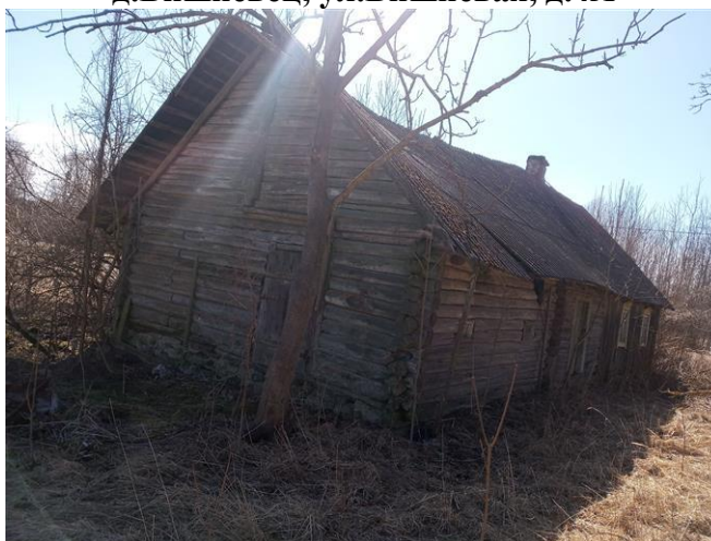
д.Янишки, ул.Садовая, д.5