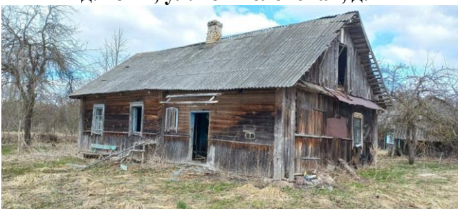
д.Кубелевщина, ул.Центральная, д.8