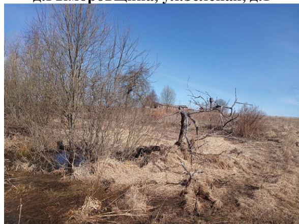
д.Рыморовщина, ул.Зелёная, д.1