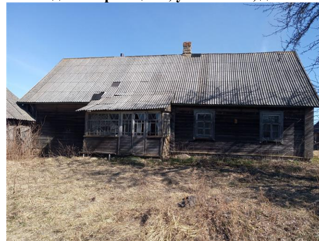
д.Рыморовщина, ул.Зелёная, д.4