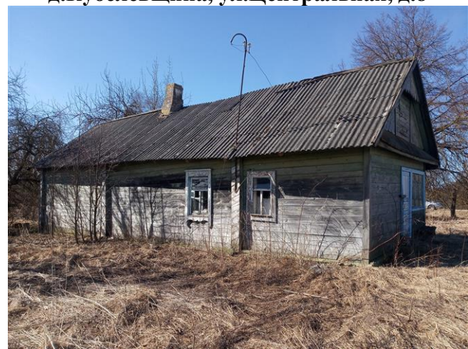
д.Кубелевщина, ул.Центральная, д.8