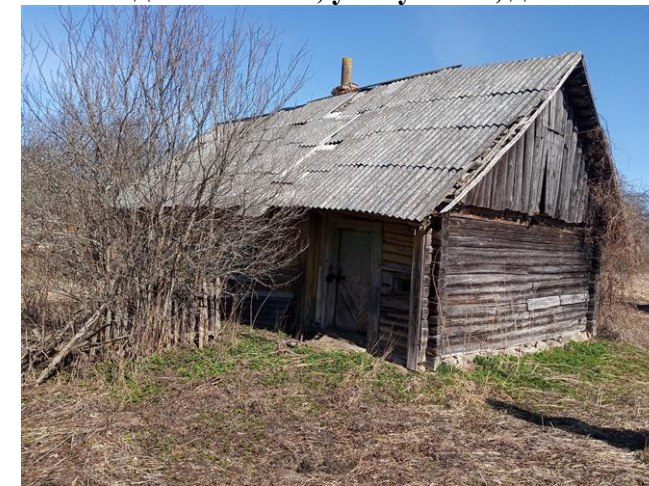
д.Борок, ул.Грибная, д.5