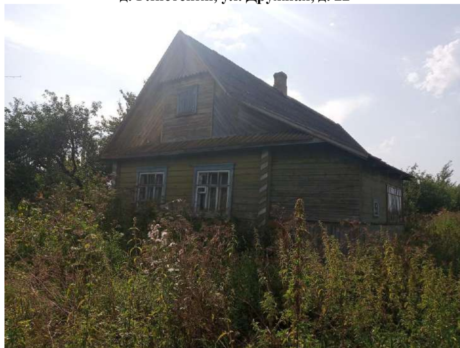
д. Глистенки, ул. Дружная, д. 22