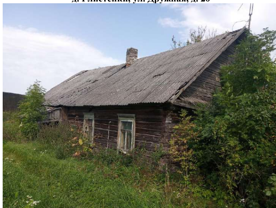
д. Глистенки, ул. Дружная, д. 20