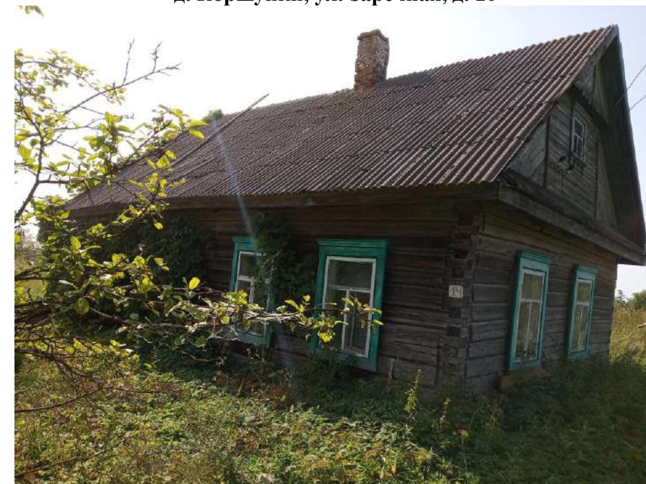
д. Коршунки, ул. Заречная, д. 10