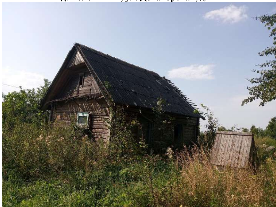
д. Воложинки, ул. Доваторская, д. 24