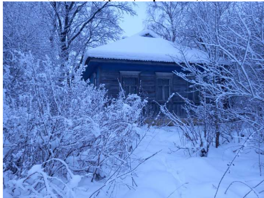
д.Иваново, ул. Центральная, д.34