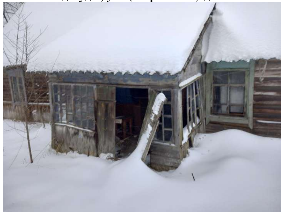
д.Буды, ул.Центральная, д.37