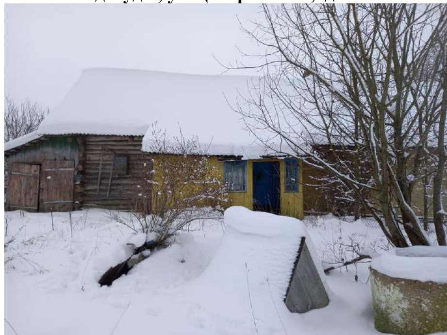
д.Буды, ул.Центральная, д.35