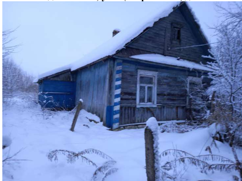
д.Иваново, ул. Центральная, д.8