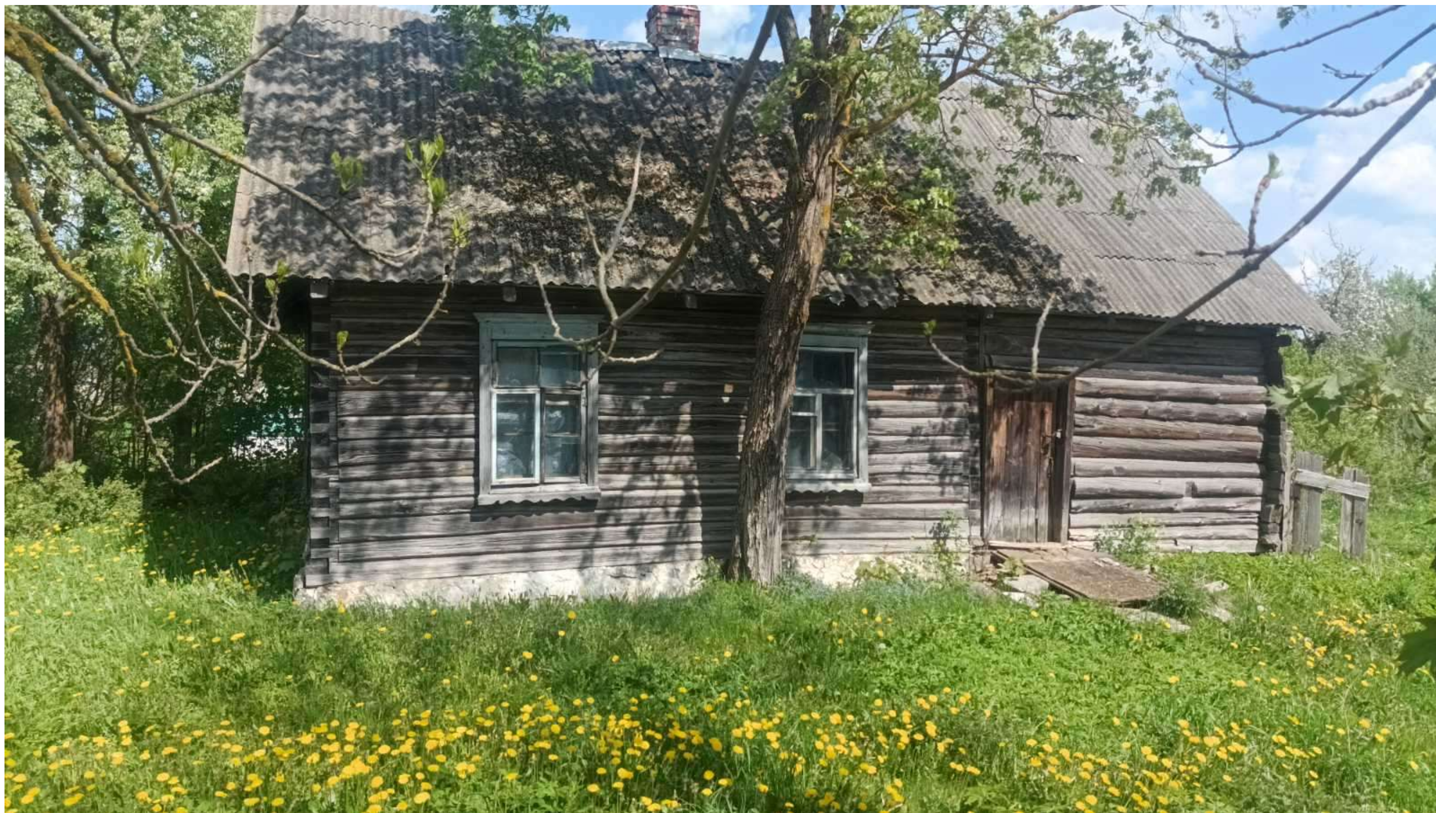
аг. Иоды, ул. Школьная, д.2