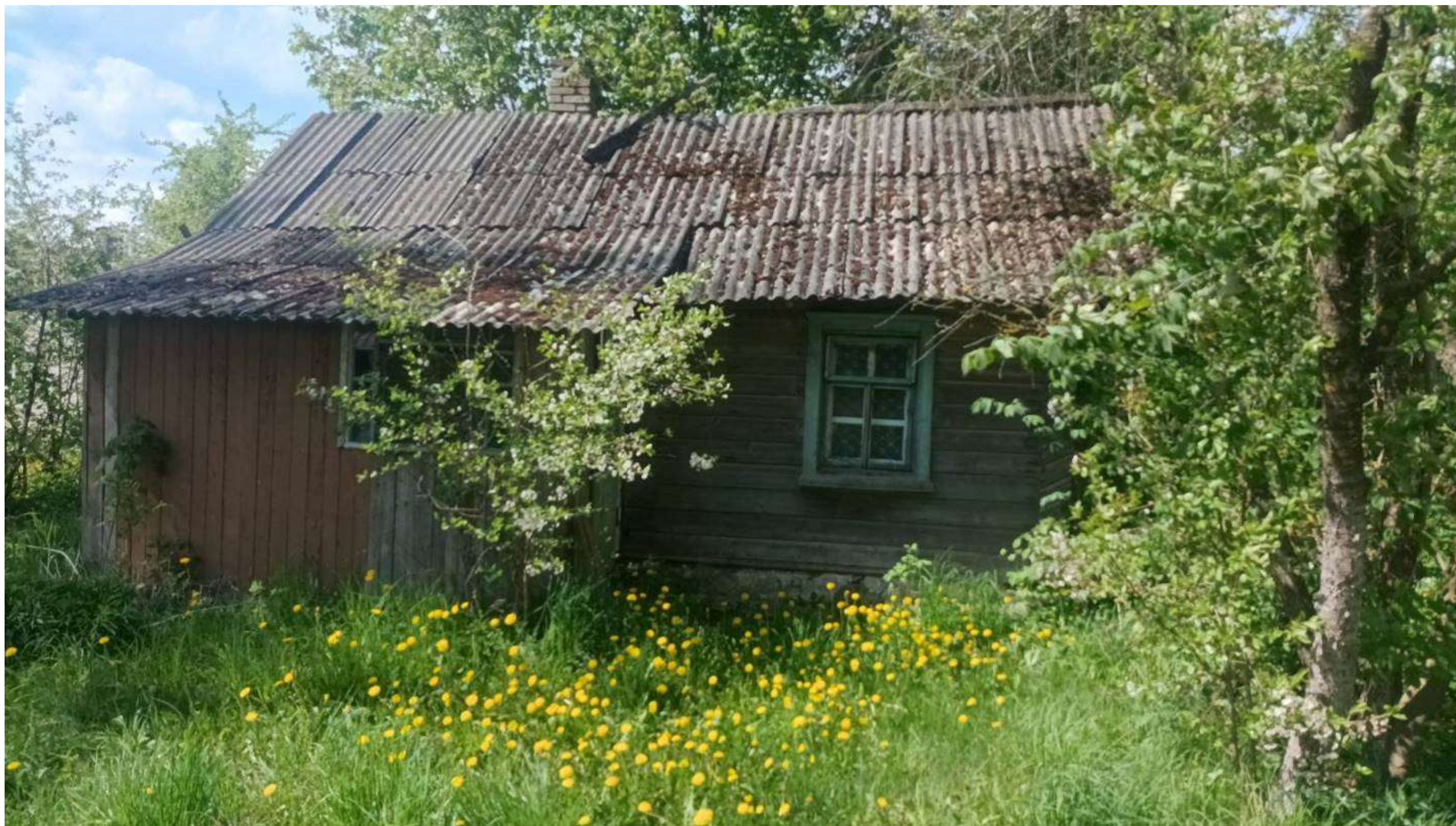
аг. Иоды, пер. Садовый, д. 2а