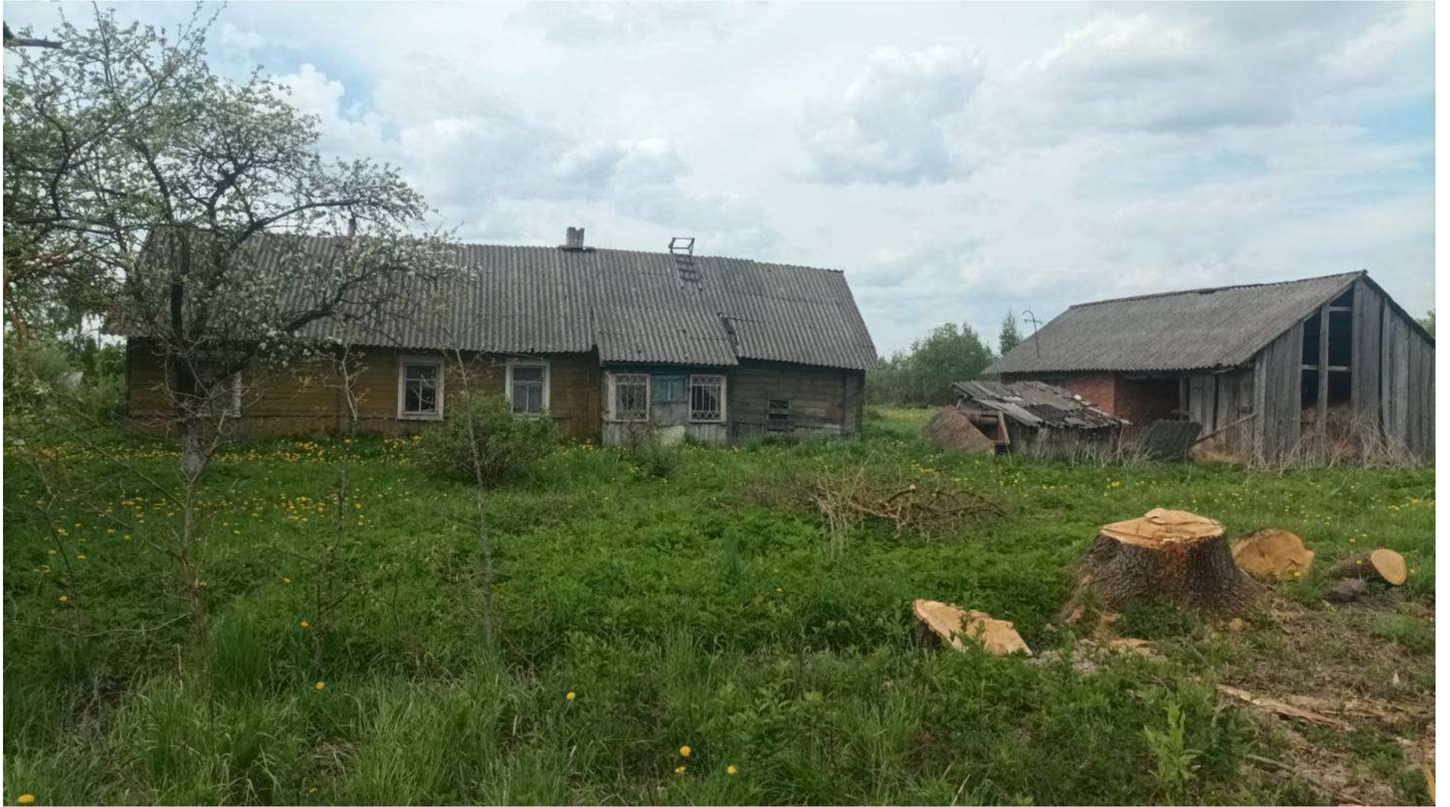
аг. Бувщина, ул. Центральная, д. 29