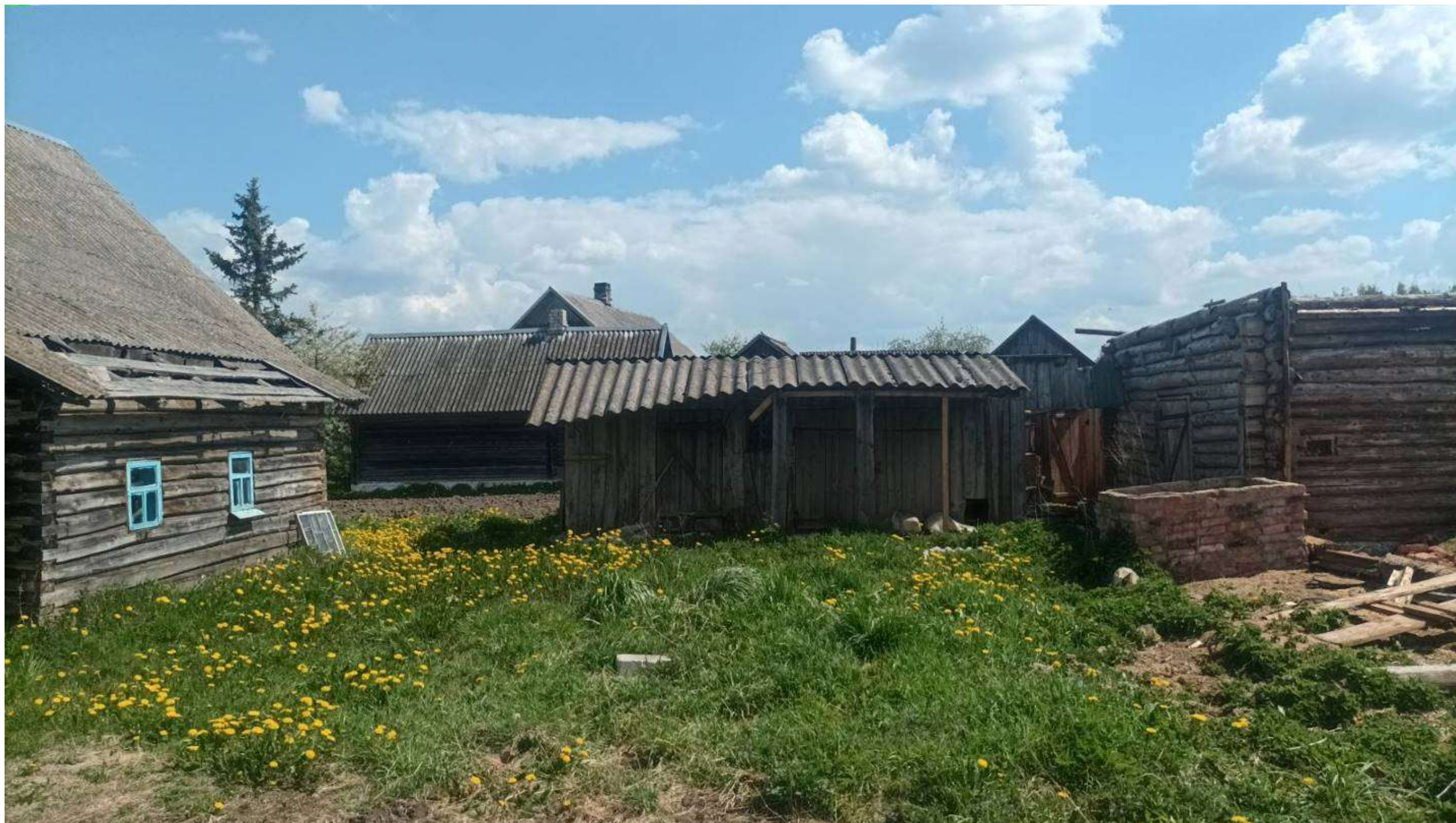
аг. Иоды, ул. Молодежная, д. 4