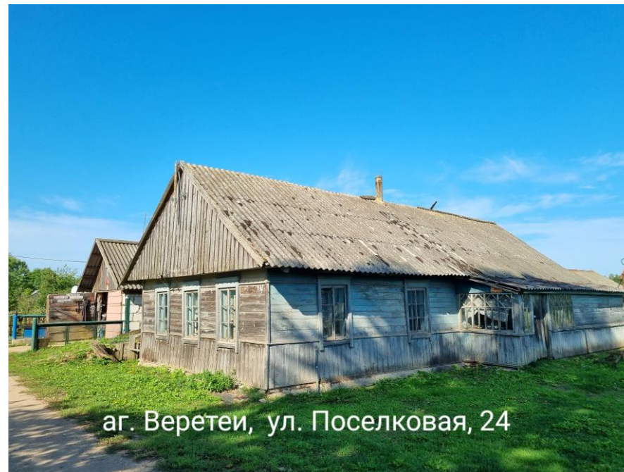
аг. Веретей, ул. Поселковая, 24