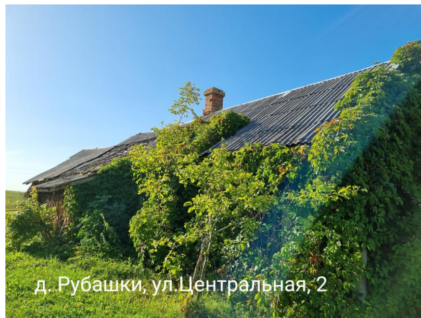
д. Рубашки, ул. Центральная, 2