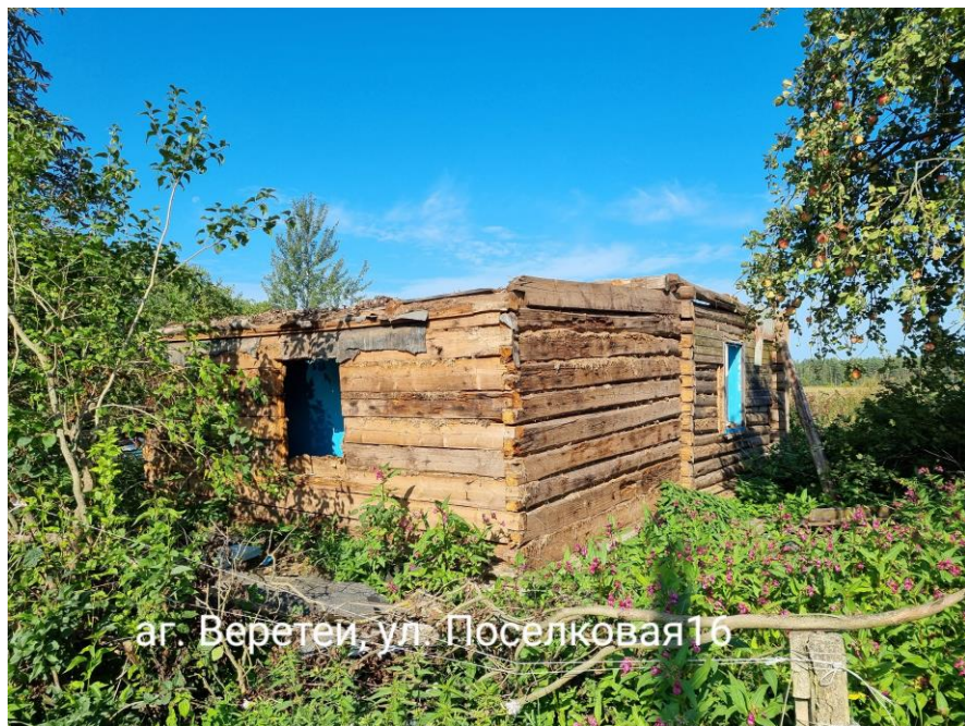
аг. Веретей, ул. Поселковая 16